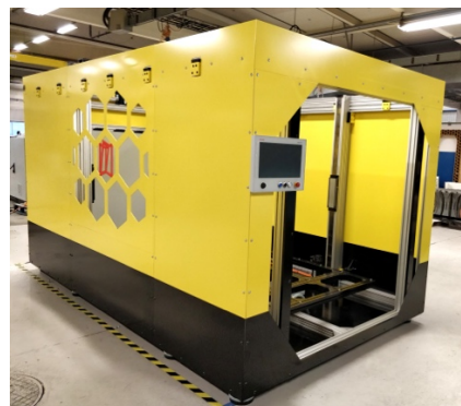
Byggnation av NorDans 3D-skrivare hos BLB Industries AB

(Yttermått på 3D-skrivaren är B: 2,4 m H: 2,7 m L: 4 m)